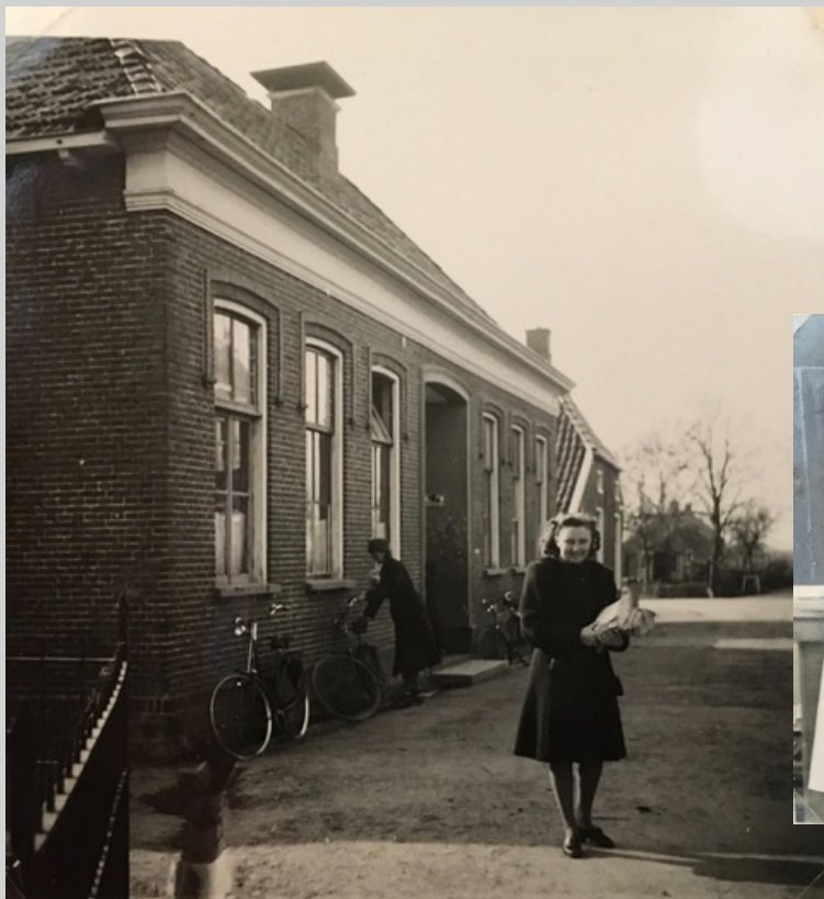
04-05. Buitenzijde en interieur van het distributiebureau aan de Hendrik Westerstraat 4 te Ten Boer, de voormalige OLS/ULO. 06. Boven een foto van het personeelsbestand van het distributiekantoor.